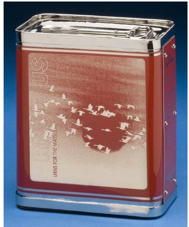
Richard Finney, Urns R Us , 2008, laiton et aluminium gravé