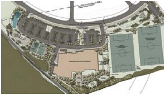
Vue aérienne du plan d'implantation du Complexe récréatif de Kanata Nord.

Six artistes régionaux ont été retenus par le comité pour des commandes pour le compte du Complexe récréatif de Kanata Nord :