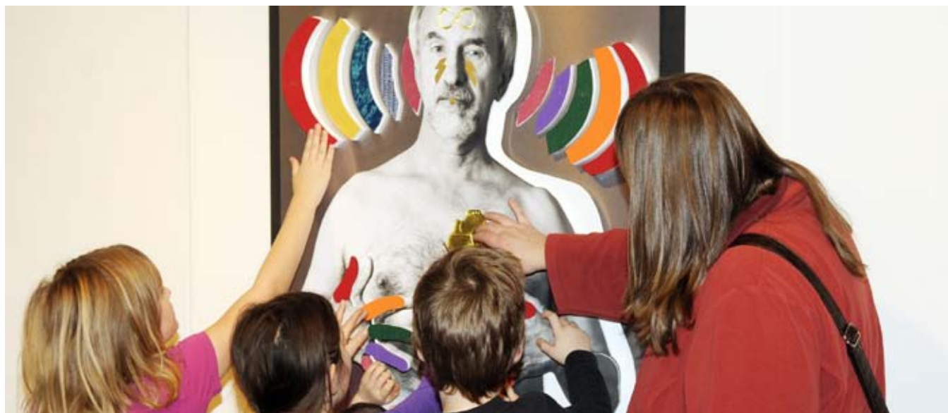
Les élèves de l'École St-Mathieu à Hammond, Ontario, visitent l'exposition durant la Journée de l'accessibilité 2010. L'exposition Perceptions a été lancée durant la Journée de l'accessibilité (3 décembre) en reconnaissance de la Journée internationale des personnes handicapées.