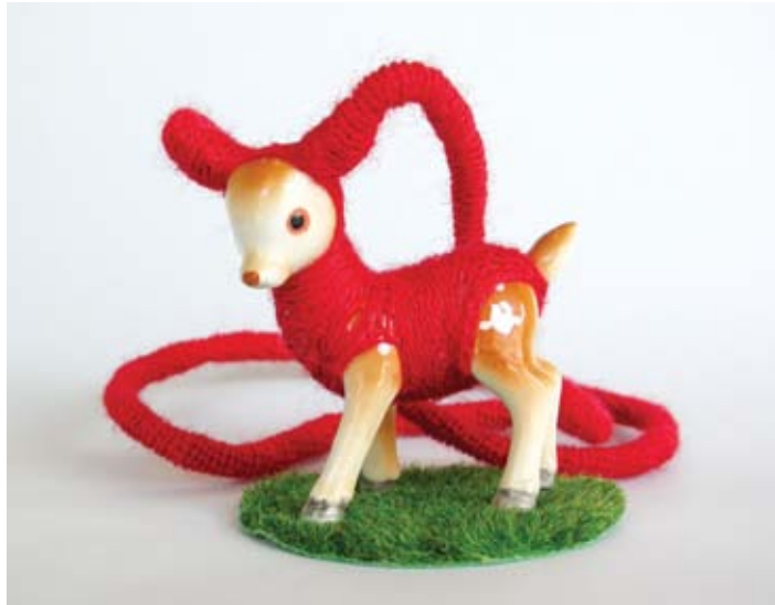
Anne Lene Løvhaug, Little Sister Happy , 2005, préfabriqué, laine

L'Ambassade royale de Norvège, en partenariat avec l'Association norvégienne d'art et d'artisanat, est fière de présenter cette exposition itinérante dans laquelle l'art et l'artisanat sont étroitement liés dans une fusion insoluble entre la forme et le concept. Le concept est dans la forme; la forme est le support du concept. Vingt-deux objets créés par des artistes et des artisans norvégiens démontrent les liens entre la réalisation de l'œuvre et les idées génératrices de sa production.