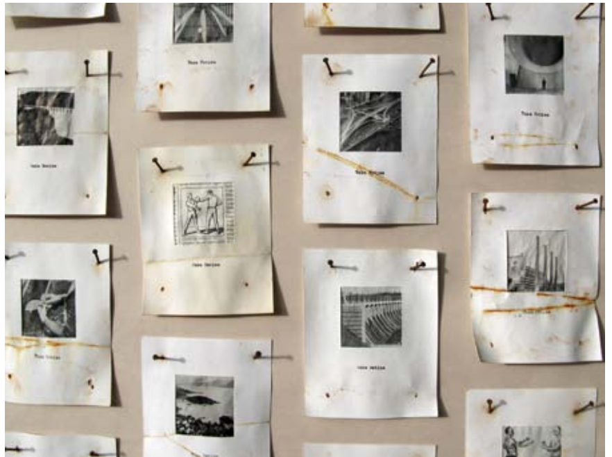
Paul Roorda, Take Notice (détail), 2010, technique mixte

Des images originales d'encyclopédie et des photos polaroïd du ciel sont épinglées à des poteaux électriques, qui s'abîment avec le temps. Découverts sur place ou regardés en tant qu'objets de collection dans la galerie, ces éléments reflètent l'anxiété grandissante face aux changements climatiques qui ont remplacé la baisse d'optimisme envers le progrès durable.